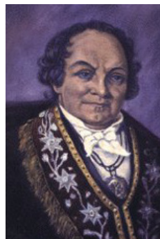
Thomas Wildey f. 15.1.1783 d. 19.10.1861

Thomas Wildey var vagnsmed till professionen och övermästare i ett par loger i England. På grund av dåliga tider emigrerade han till Amerika och saknade då sina Odd Fellowbröder. Han lyckades där finna några likasinnade och den 26 april 1819 kunde han tillsammans med dessa bröder instituera logen nr 1 Washington i Baltimore, på världshuset "Seven Stars", som blev första hemvist för Orden.